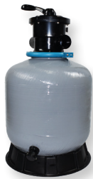
Filtro bobinado + bomba MICRO Bobbin-wound filter + MICRO pump Filtre bobiné + pompe MICRO