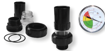
Componentes kit filtración Filtration kit components Composants du kit de filtration