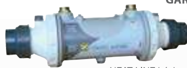
HEAT LINE básico