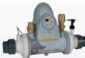
HEAT LINE sin bomba de recirculación