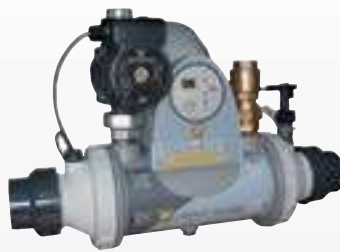
HEAT LINE Plus